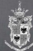
Comune di Fermo