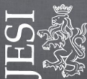
Comune di Jesi