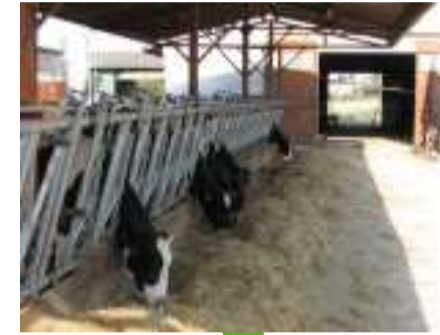
Moroni Celso via dell'Industria, 29 POLVERIGI (AN)