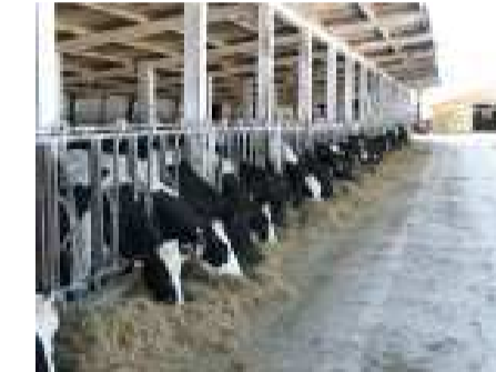
Azienda Agraria Rocca Priora via Clementina, 16 FALCONARA M (AN)