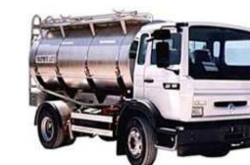
Trasporti Molinari JESI ANCONA

Temperatura latte alla raccolta: 6,00 gradi Numero di munte: 2 Targa autoveicolo di raccolta: BZ975FL Tipologia latte bovino: requisiti D.M. 185/91 Comparto cisterna: 2 Data ultima mungitura: 11/04/2010 Ora ultima mungitura: 16:00:00