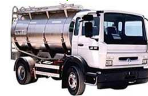
Trasporti Baleani AGUGLIANO ANCONA

Temperatura latte alla raccolta: 6,00 gradi Numero di munte: 2 Targa autoveicolo di raccolta: BZ975FL Tipologia latte bovino: requisiti D.M. 185/91 Comparto cisterna: 2 Data ultima mungitura: 11/04/2010 Ora ultima mungitura: 16:00:00