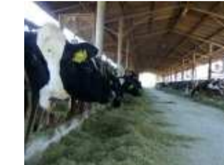
Stalla San Fortunato Via San Fortunato, 11 SERRA DE'CONTI (AN)