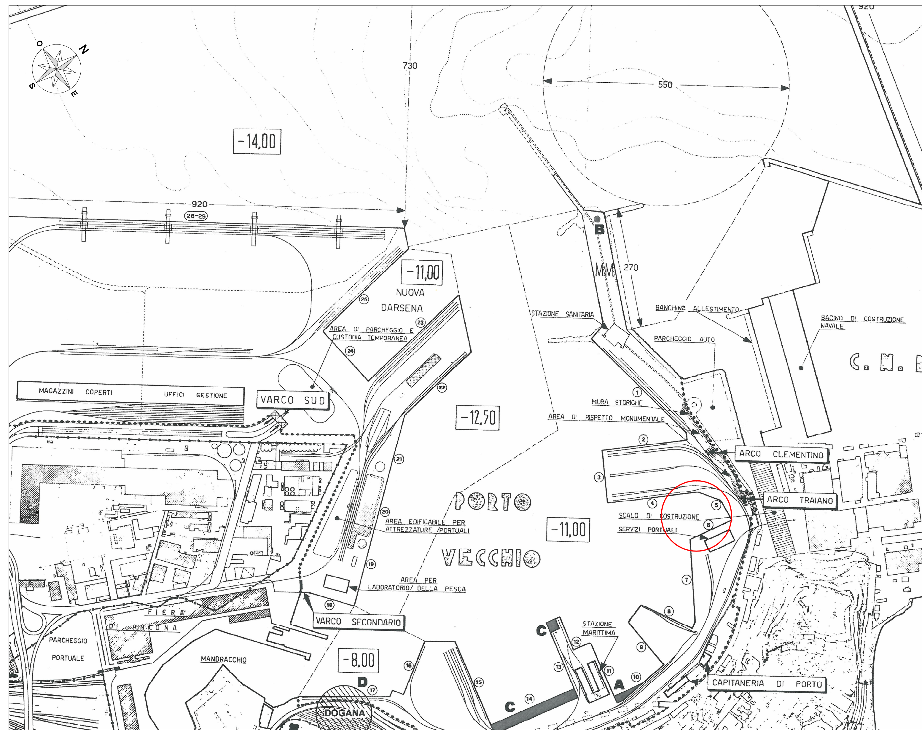
STRALCIO P.R.P. ATTUALE (D.M. LL. PP. 1604 del 14.07.88) scala 1:5000