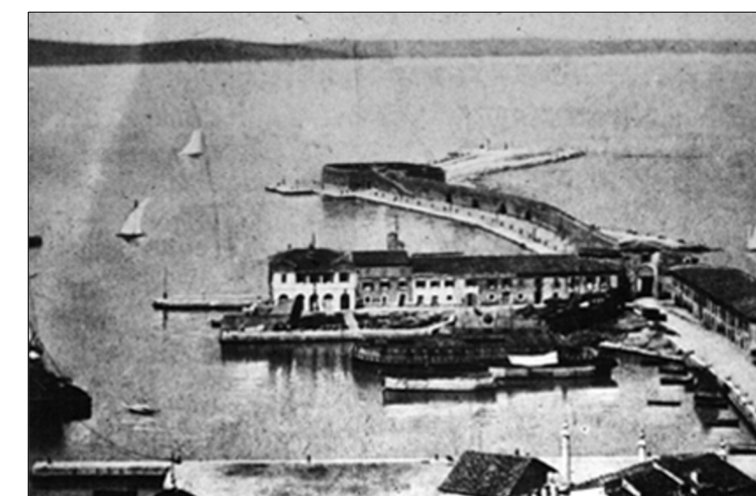
Foto Molo Nord fine '800 con la Lanterna