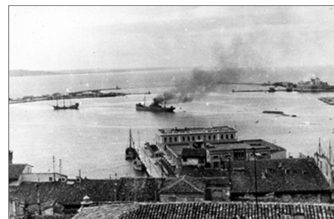
Foto panoramica del porto fine '800