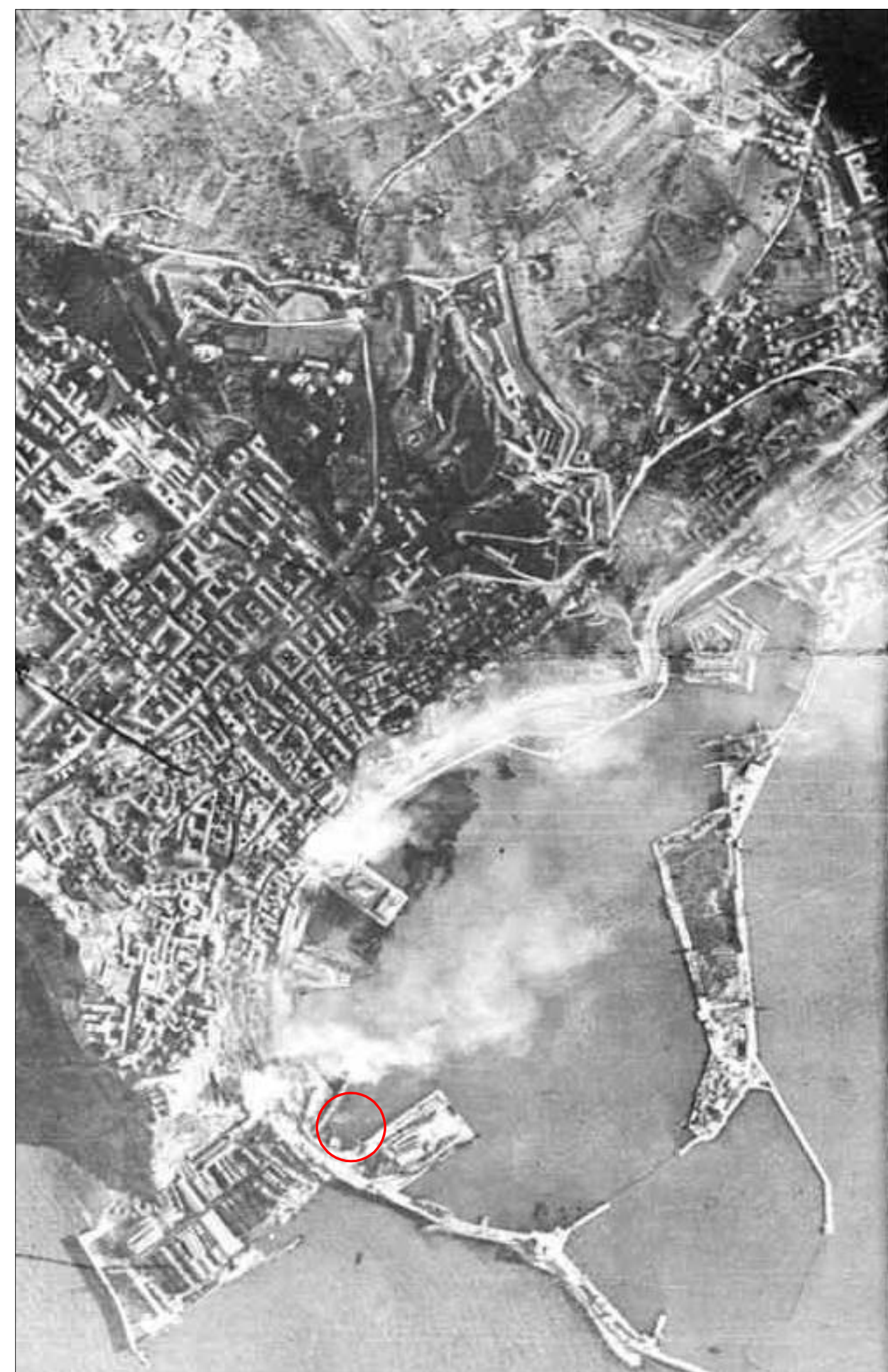
Aerofotogrammetrico 1944 (bombardamenti)