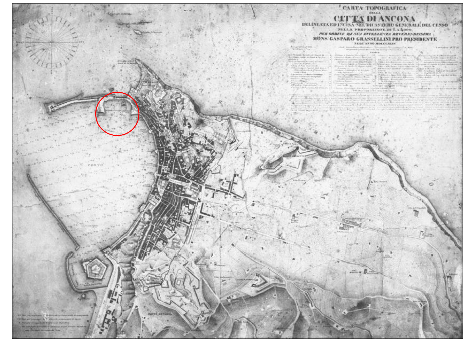
ANCONA (Grassellini) - 1844