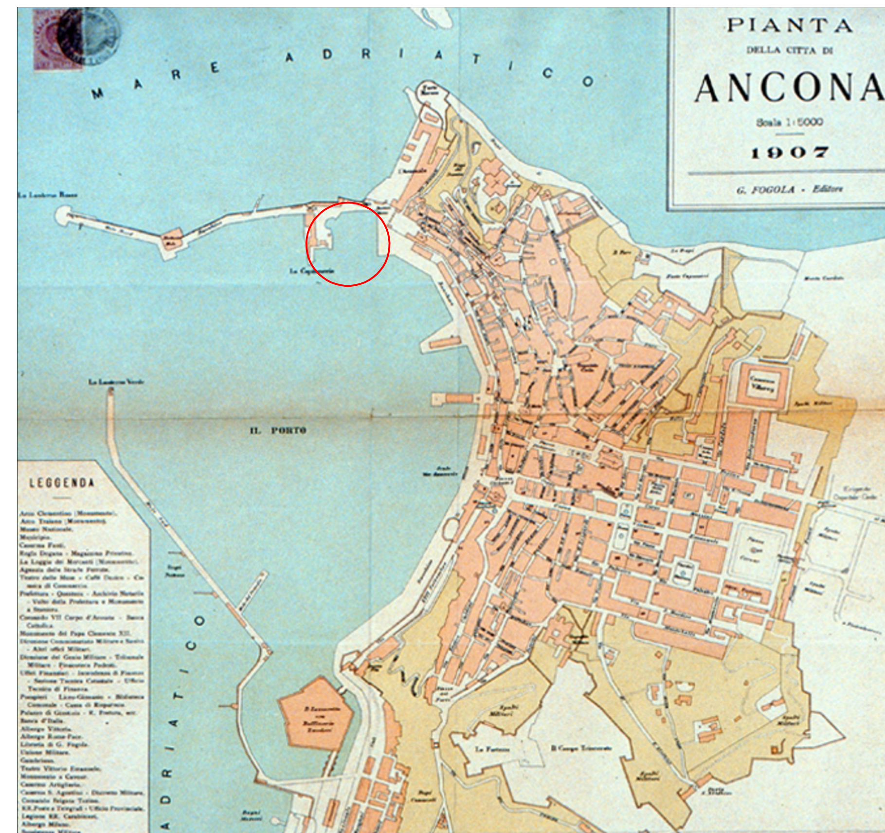
Pianta della Città di Ancona - 1907