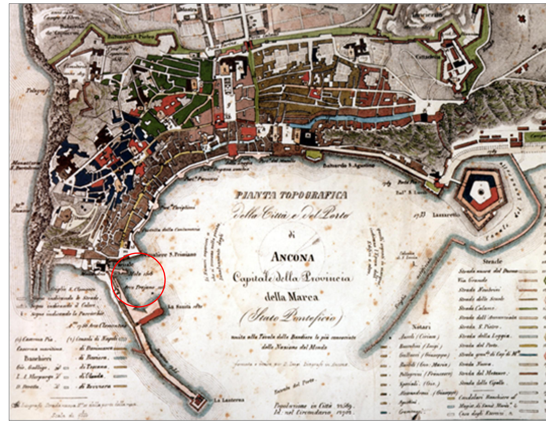
ANCONA - 1830