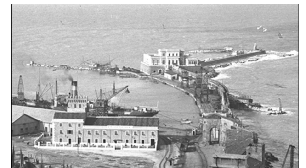
Foto Molo Nord 1900 con la Sanità Marittima