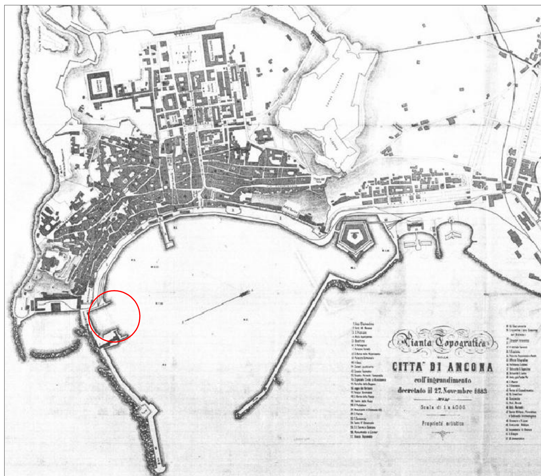
ANCONA - (Feroso) 1883