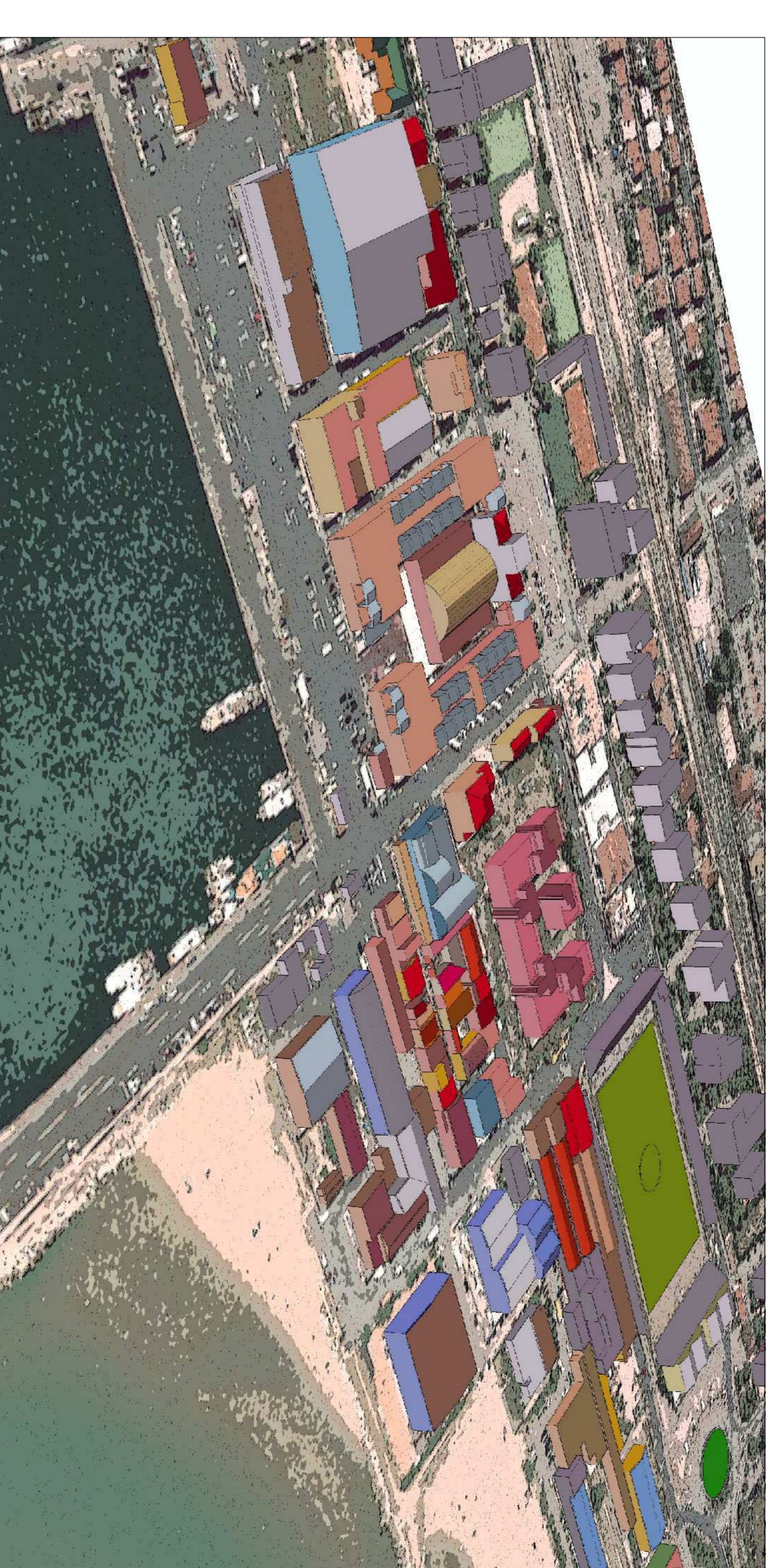
AMBITO PORTUALE NORD