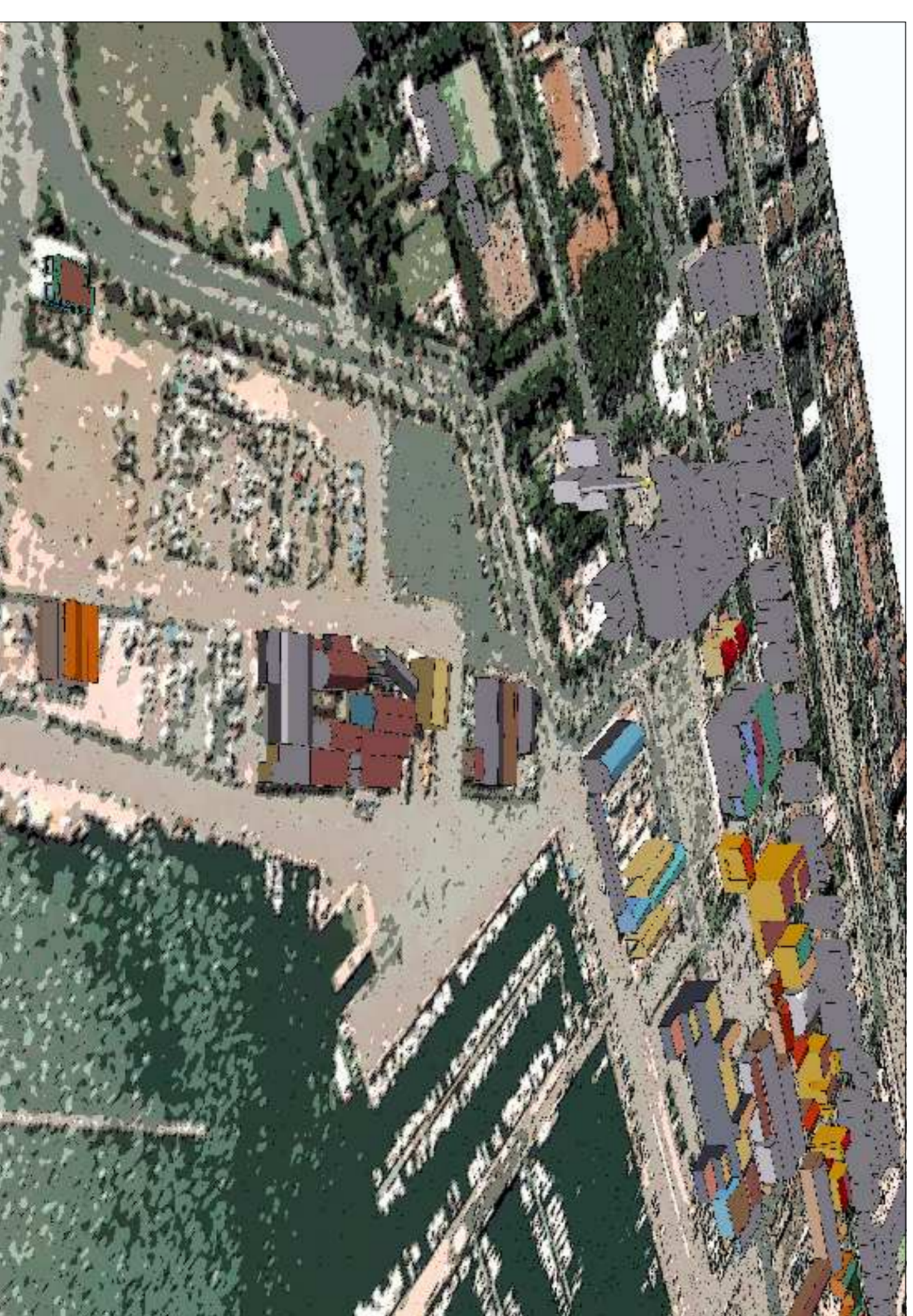
AMBITO PORTUALE SUD