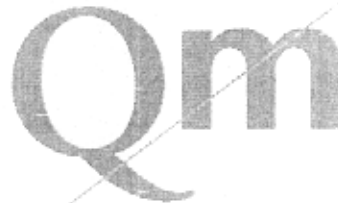
QUALITÀ GARANTITA DALLE MARCHE