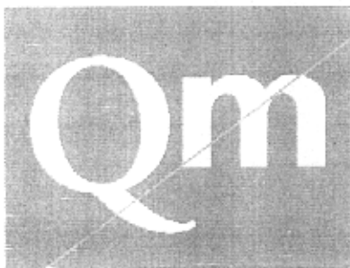
QUALITÀ GARANTITA DALLE MARCHE

E' vietata qualsiasi riproduzione diversa da quelle sopra raffigurate. A titolo di esempio vengono riportate alcune possibili alterazioni: