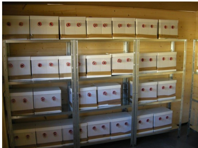
Foto 4 Raccolta galle per verifica insediamento